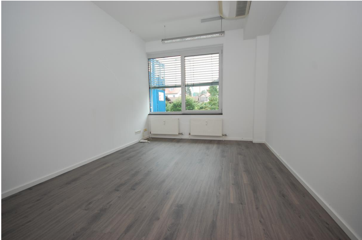
Büro Gruber 2 mitte