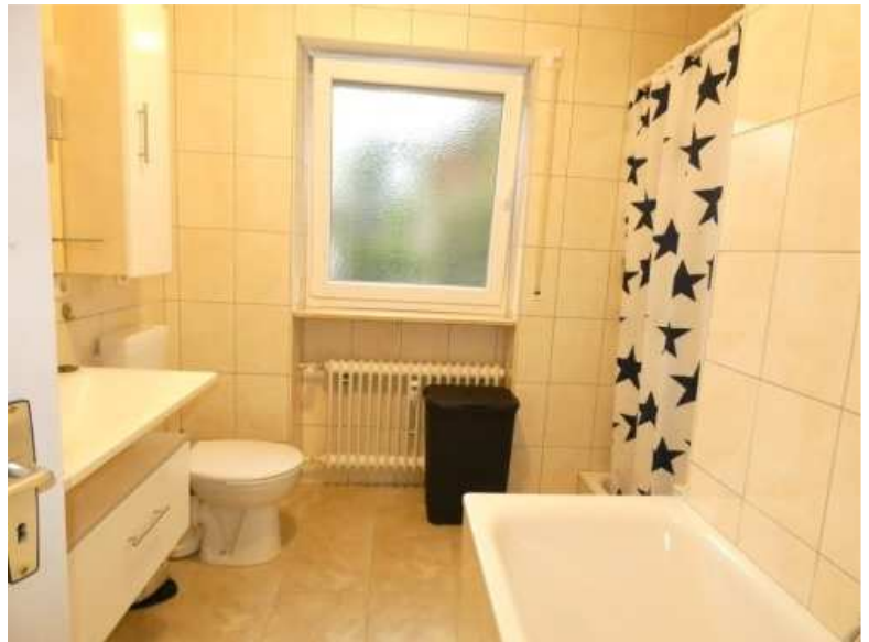
Bad mit Wanne und Dusche